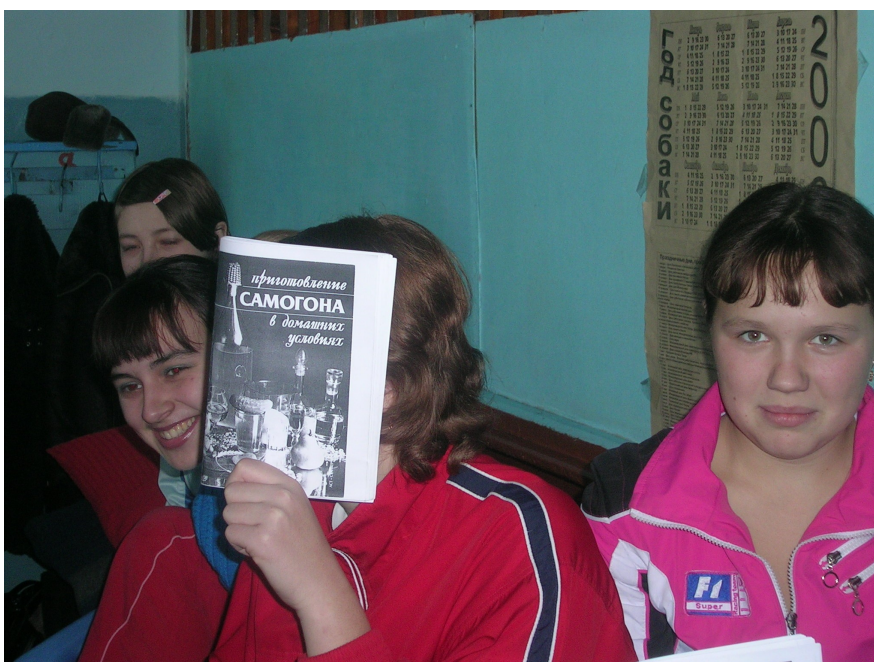
Факультатив в раздевалке по теме... (читай на обложке учебного пособия)