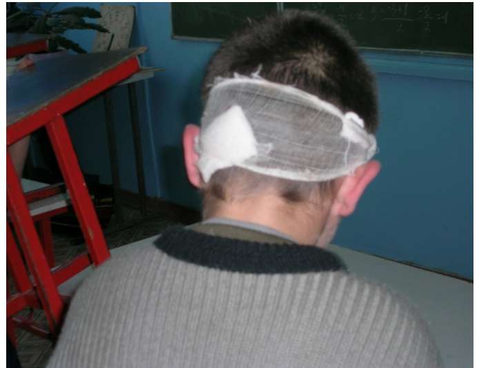
Последствия физкультуры и спорта на перемене