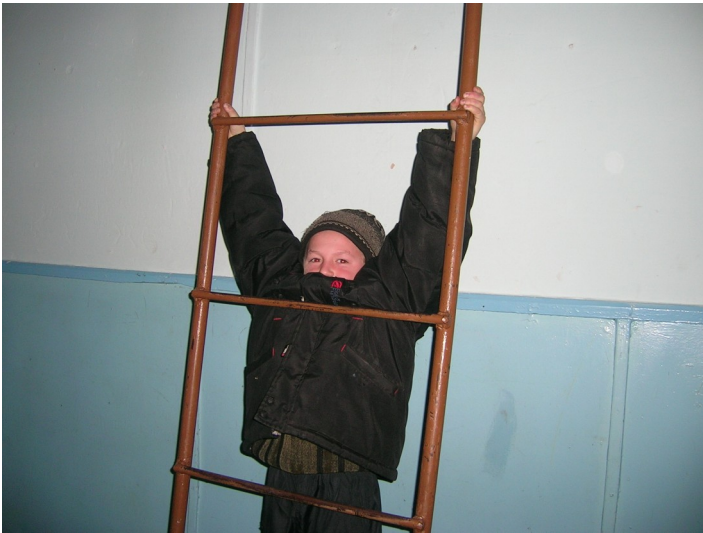
Физкультура и спорт на перемене