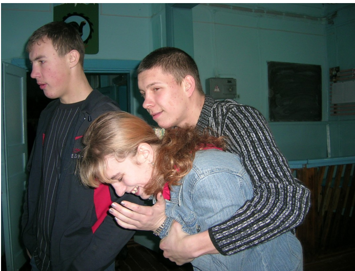
Синяки, ссадины, кровоподтеки—неотъемлемая часть учебного процесса