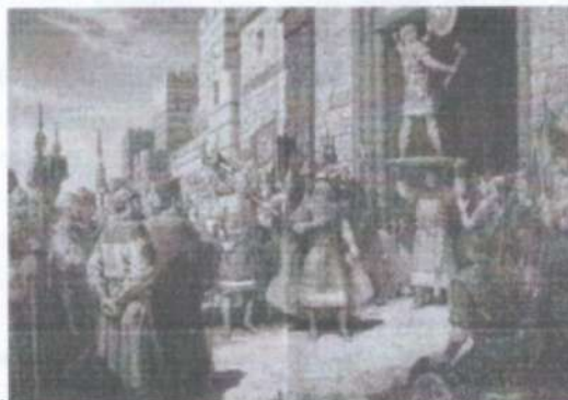
Поход на Константинополь